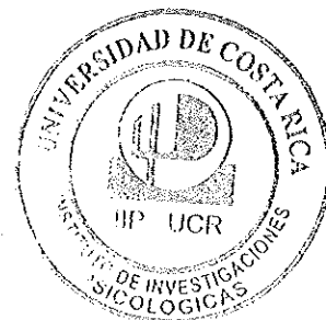
Firma Director, IIP

Con el resultado de la votación se acuerda: