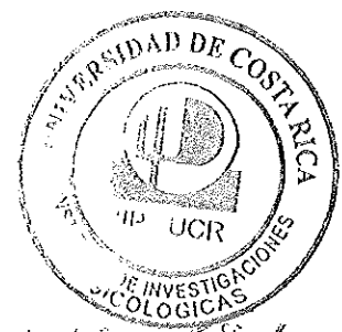
Firma Director, IIP