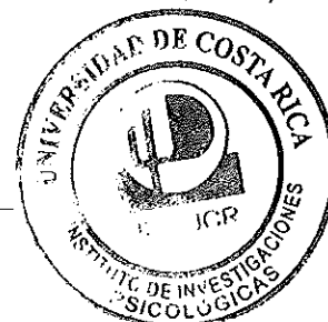
Firma Director, IIP