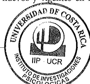
Firma Director, IIP

Dado lo anterior la investigadora solicita la redistribución de su carga académica a partir del 01.11.2014, de acuerdo con los proyectos de investigación nuevos y vigentes en los que participa y participará de la siguiente manera: