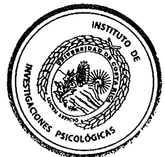
Firma Director, IIP

C:\TRABAJO\Consejo Científico\CC-2015 CC-070-2015.doc