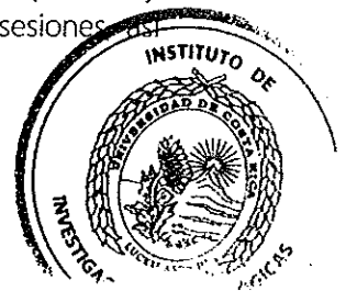
Firma Director, IIP